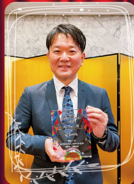
■アクション賞 (SDGs活動に積極的に取り組み、他の組合員に向けても開示・発表した会員)