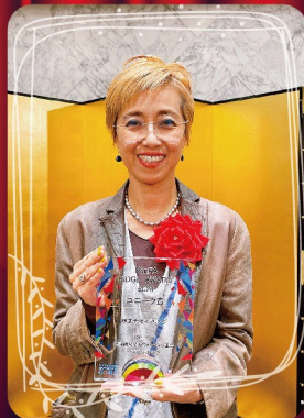
■ユニーク賞 (SDGs活動にユニークな内容又は独自のアイデアで取組む会員)