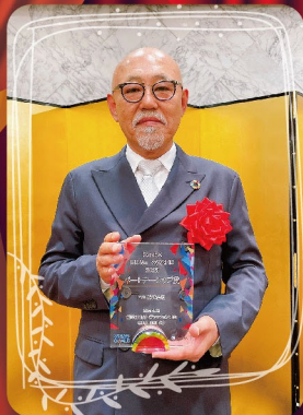
■パートナーシップ賞 (SDGs活動に積極的に取り組み、特にSDGs推進室の活動テーマに貢献・協力した会員)