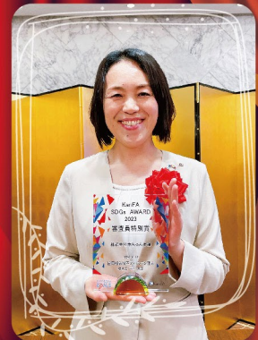
■審査員特別賞 (選考委員から高い評価をいただいた会員)