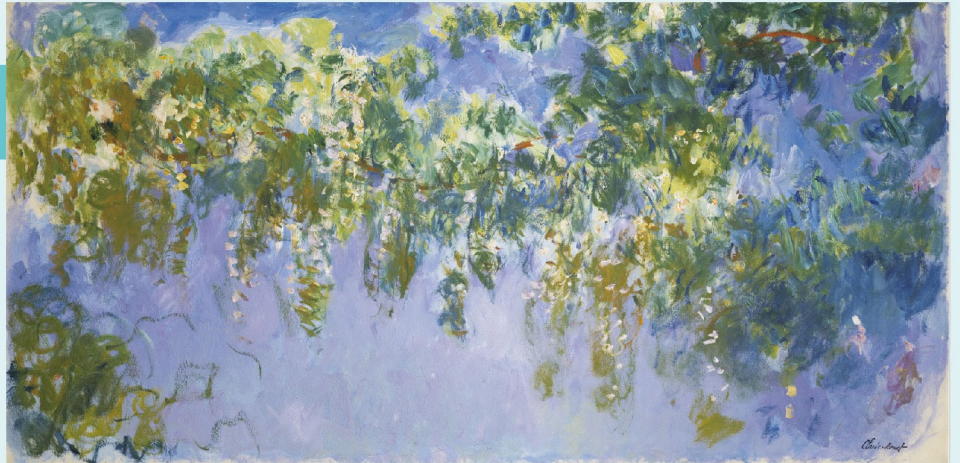
《藤の習作》1919-20年 油彩、カンヴァス 100.0×200.5cm ドゥルー美術歴史博物館 Musée d'art et d'histoire de Dreux, © F. Laguinie